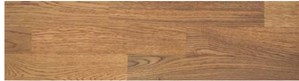
Trip Trap Colouröl 104 rotbraun