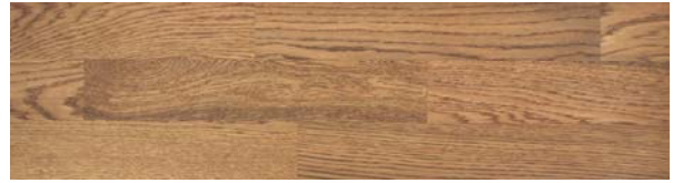
Trip Trap Colouröl 106 dunkelrotbraun