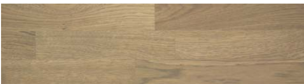
Trip Trap Colouröl 314 extragrau