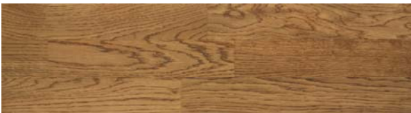
Trip Trap Colouröl 105 mittelbraun