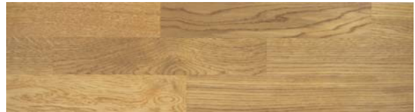
Trip Trap Colouröl 117 currygelb