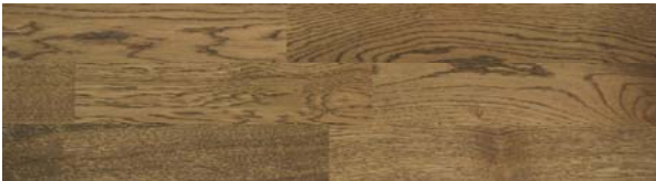
Trip Trap Colouröl 102 dunkelbraun