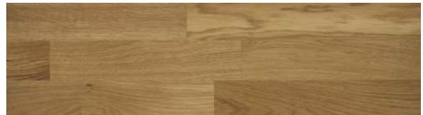
Trip Trap Colouröl 114 granitgrau