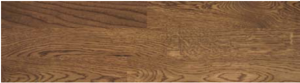
Trip Trap Colouröl 119 walnuß