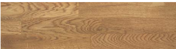
Trip Trap Colouröl 101 hellbraun